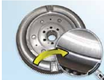
Şekil 6: LuK DMF; çevreleyen girintinin bulunduğu motor kenarı