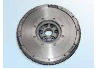
Şekil 5: Sachs DMF; şanzıman kenarı