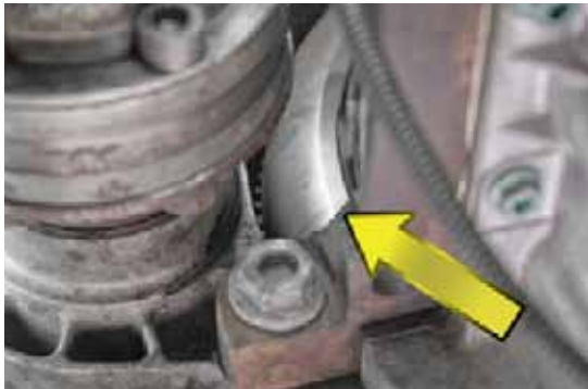
Şekil 3: Farklı özellikler muhafaza kapak levhası çıkarıldığında görünür hale gelir.

Şekil 4-7 numaralı her iki çift kütleli volanın farklı özelliklerini gösterilmektedir. Araca monte edildiğinde, bu özellikler şanzıman muhafazasındaki pencereden (Şekil 3) görülebilir.