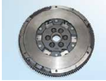
Şekil 4: LuK DMF; şanzıman kenarı