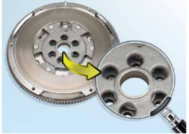
Şekil 1: Kayar Rulmanlı LuK DMF 415 0059 10

Bu bilgiye sahip olduğunuzda doğru LuK RepSet® siparişini vermeniz mümkün olacaktır.