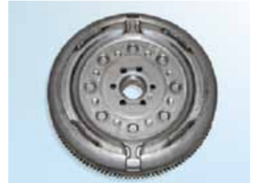
Şekil 7: Sachs DMF; girintisiz motor

⚠ Araç üreticisinin talimatlarına uyunuz!