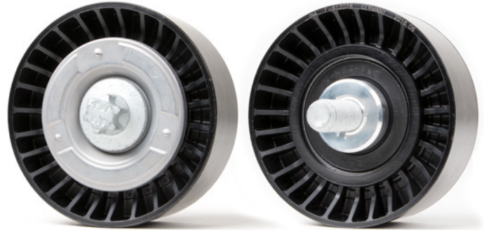
Resim 2: Yeni tasarım

Lütfen araç üreticisinin talimatlarını dikkate alın!