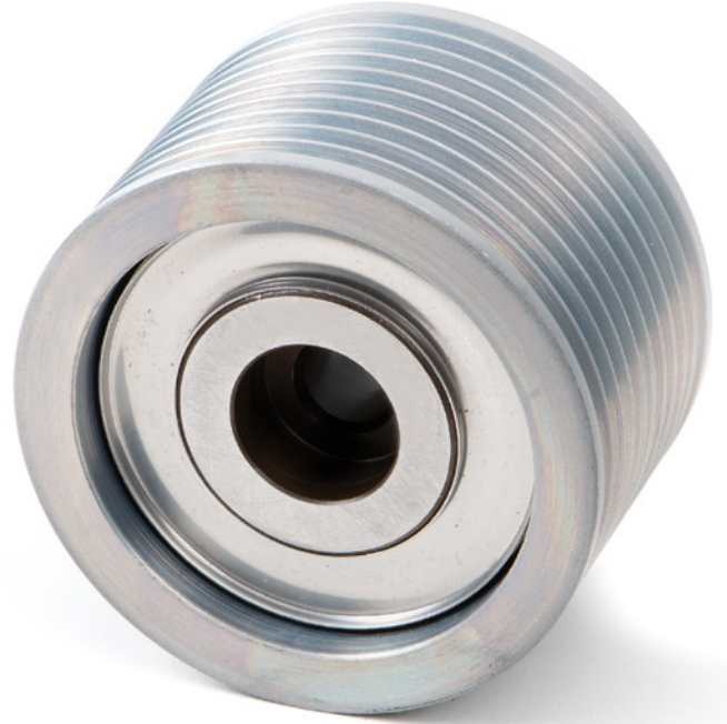
Resim 2: 532 0662 10 – INA saptırma kasmağı

Güncel liste için medya kataloğuna bakın