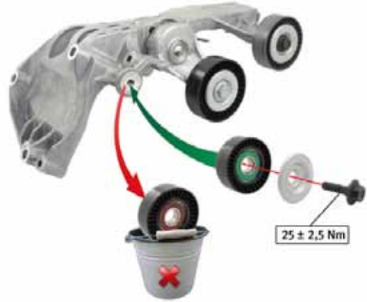
Şekil 1: Gergi ünitesi 534 0243 10

Gergi mekanizması standart olarak sadece benzinli motorlar için uygun olan saptırma kasnaklarıyla donatılmıştır.